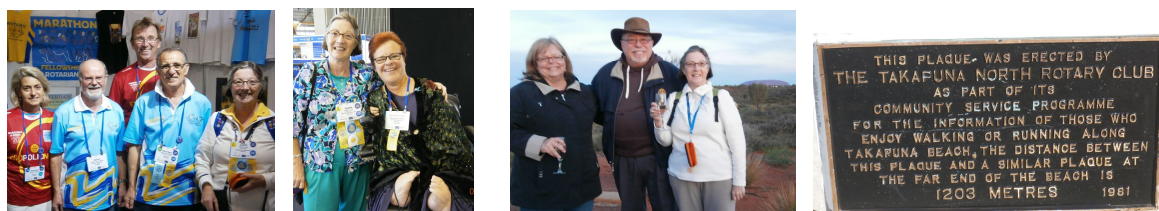
France, Belge, Australie Uluru (Ayers Rock) Auckland