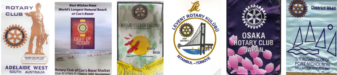
Adelaide West Falomo (en train) Levent Osaka (Au resto) Wellington NZ