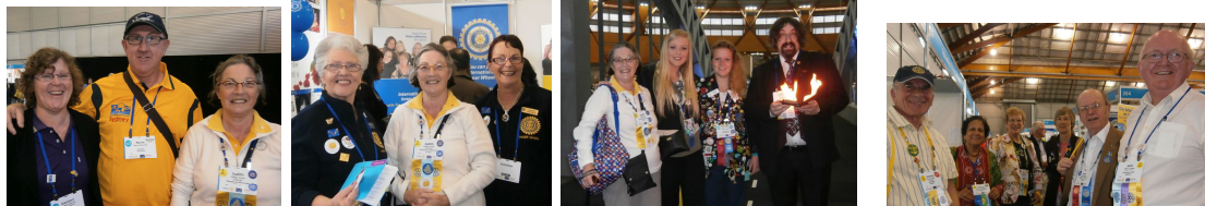
Australie IIW student exchange Londres